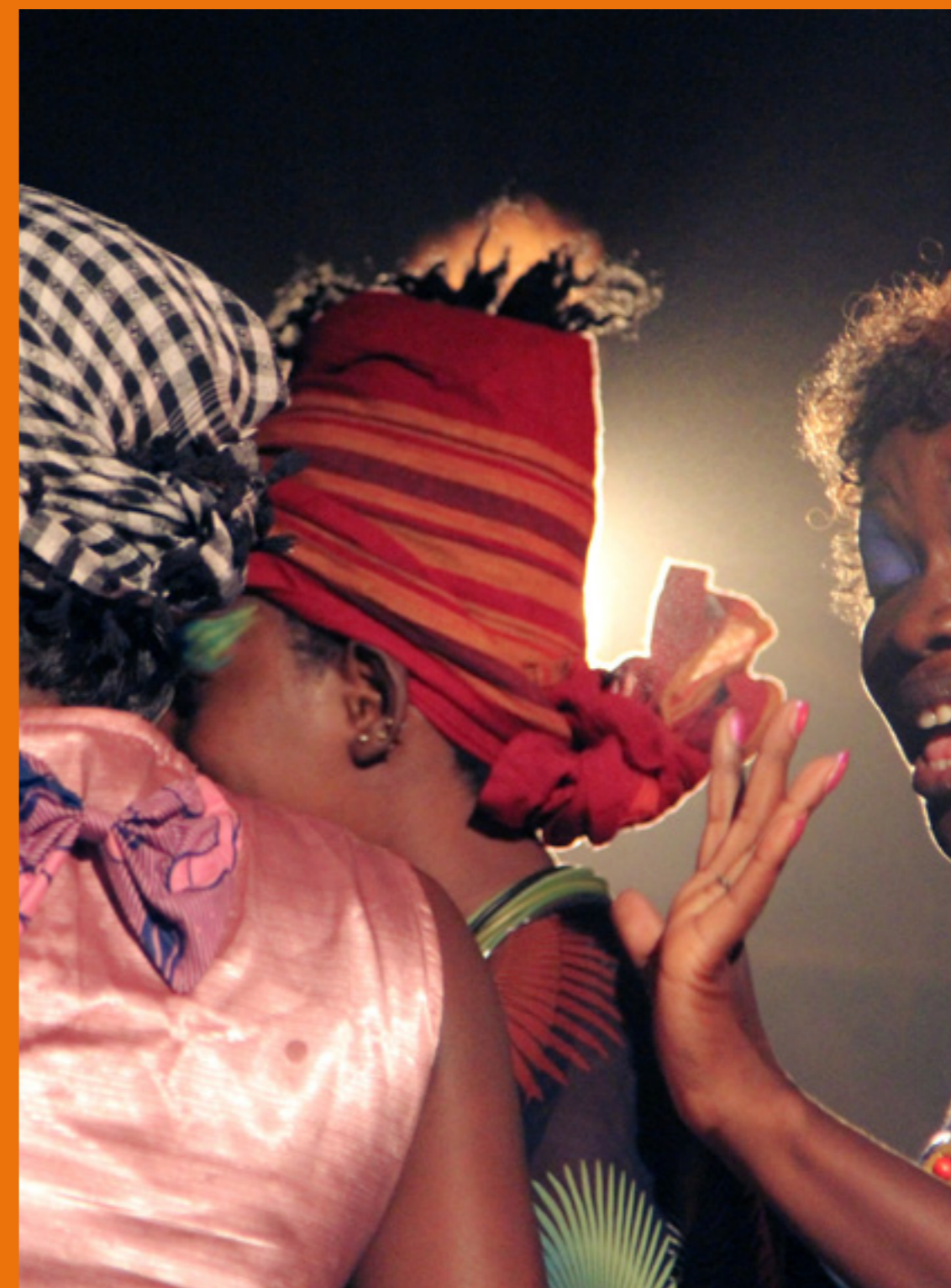
Actuación del grupo Transexpress en el Festival Rendez Vous Chez Nous. Uagadugú, Burkina Faso

10/12/15, Casa África > El Ministerio de Asuntos Exteriores y de Cooperación organizó en Casa África este encuentro destinado a profundizar su colaboración con los países africanos, de cara a la revisión en 2020 de un documento fundamental para la relación entre la Unión Europea y la zona ACP (África, Caribe y Pacífico): el Acuerdo de Cotonú. Este seminario contó con la participación del Secretario de Estado de Asuntos Exteriores, Ignacio Ybáñez; otros representantes del Ministerio de Asuntos Exteriores y de Cooperación; el Secretariado de la ACP; la Unión Europea; el Consejero de Economía, Industria, Comercio y Conocimiento del Gobierno de Canarias, otros representantes del Gobierno de Canarias, y 16 embajadores africanos acreditados en España.