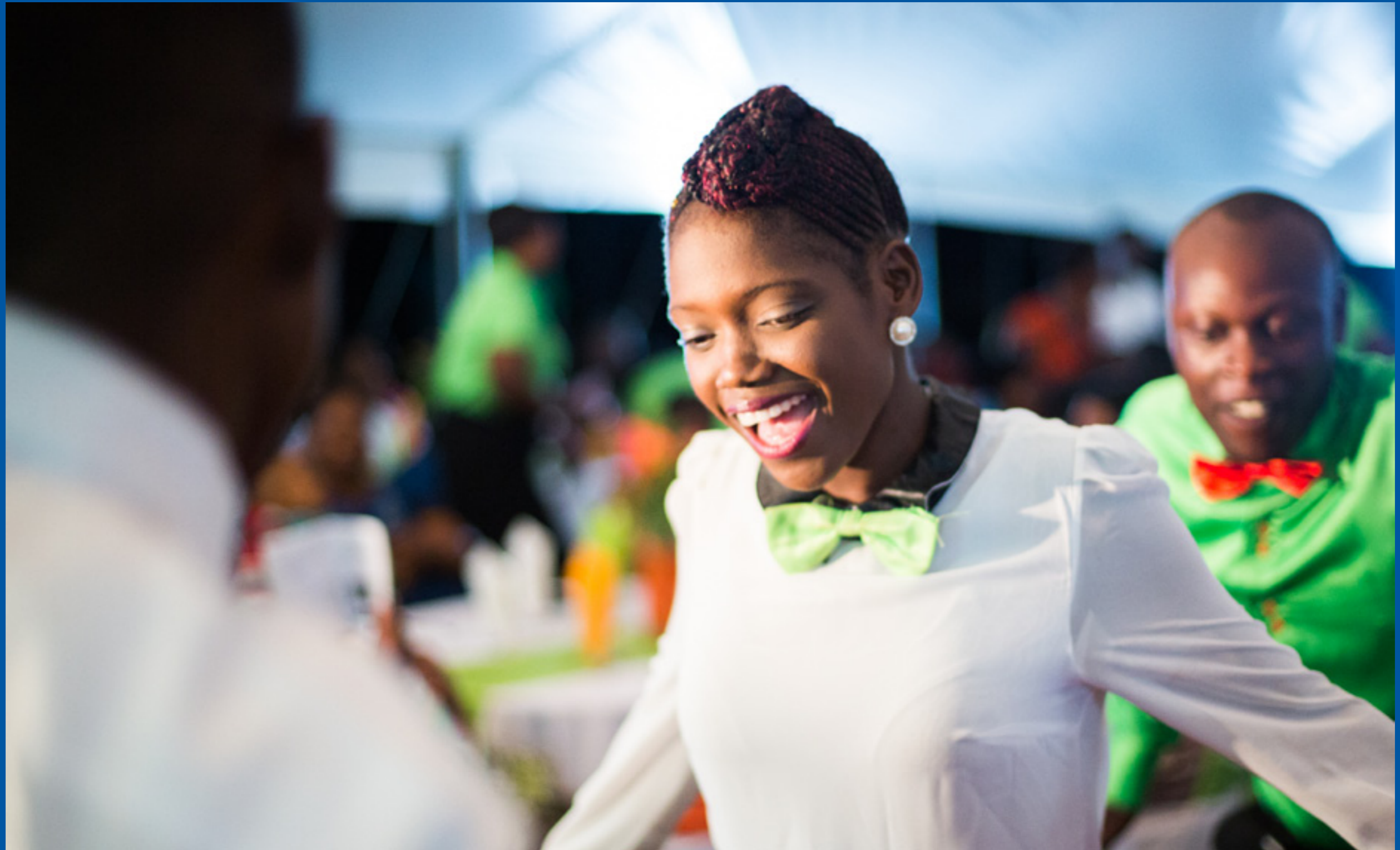
Entrada de las damas de honor. Livingstone, Zambia