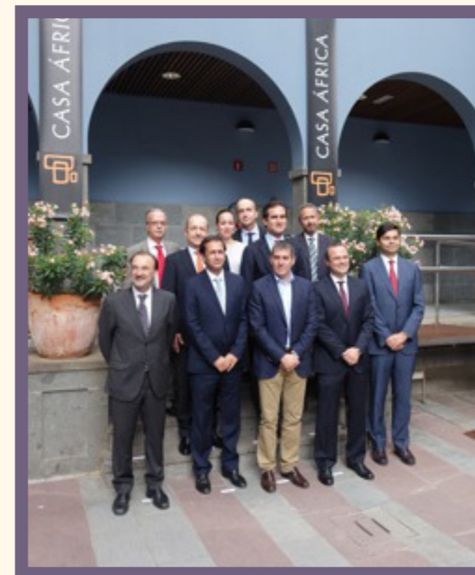
Siguiendo indicaciones del Presidente del Consejo Rector, se convocó la XV Reunión del Consejo Rector en Casa África el 20 de julio de 2015. Además, en noviembre de 2015 el Consejo Rector se reunió para, entre otros asuntos, aprobar la programación de 2016.

contrataciondelestado.es/wps/portal/plataforma