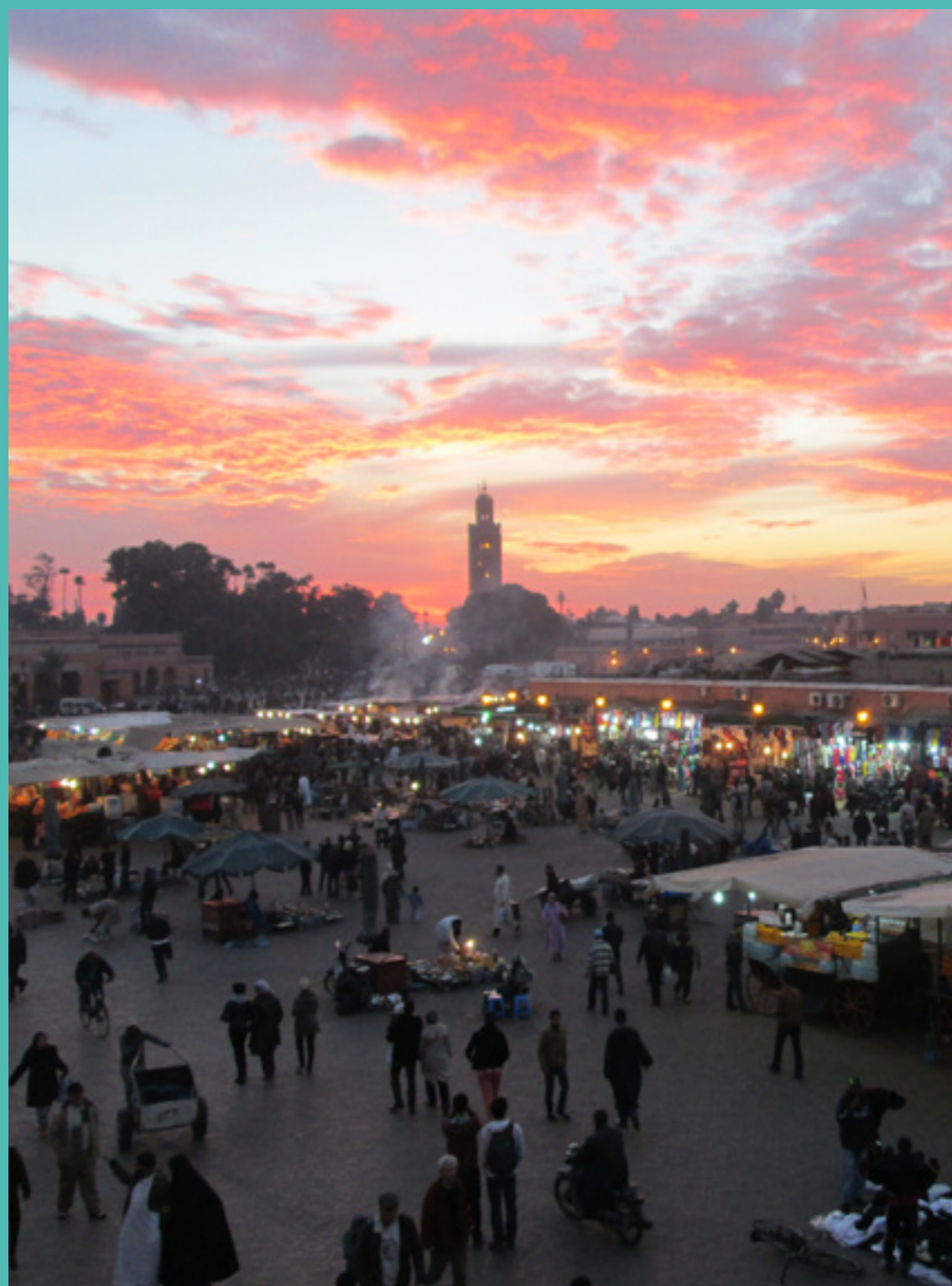
Infinita Plaza de Jamaa el Fna. Marrakesh, Marruecos