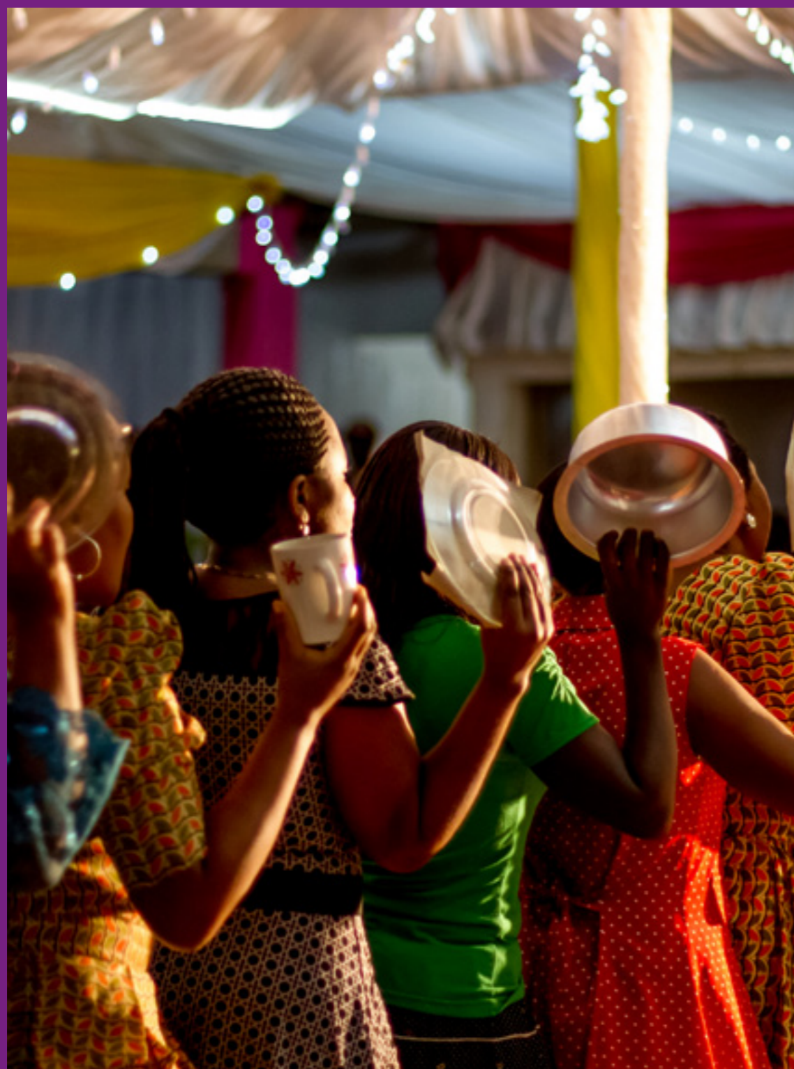
El ritual del ajuar. Kilimanjaro, Tanzania