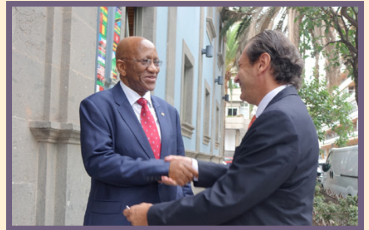
Visita del Embajador de Sudáfrica, Lulama Smuts Ngonyama, a Las Palmas de Gran Canaria en septiembre de 2015. Su agenda, coordinada por Casa África, incluyó, además, reuniones con otras instituciones y empresas canarias.

En la promoción de Canarias como hub para África, Casa África se define, asimismo, como un espacio de encuentro, intercambio y conocimiento mutuo. Gracias a la institución que dirijo, Canarias son conocidas por un gran número de expertos, investigadores, diplomáticos y altos cargos. Personas que deciden qué, cuándo y cómo se hace en el continente africano o con respecto a él. Participan en actividades como el Encuentro de Think Tanks África-España o Más allá