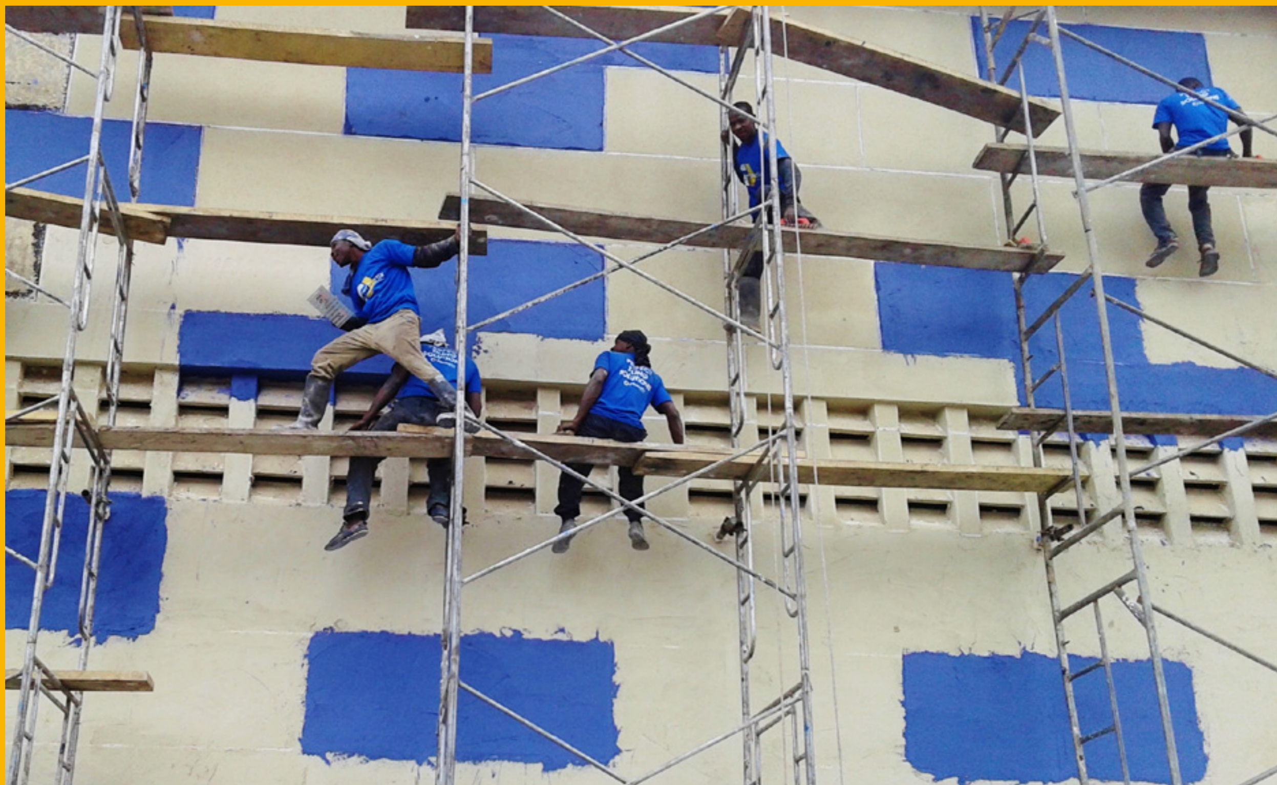
Autóctonos. Accra, Ghana