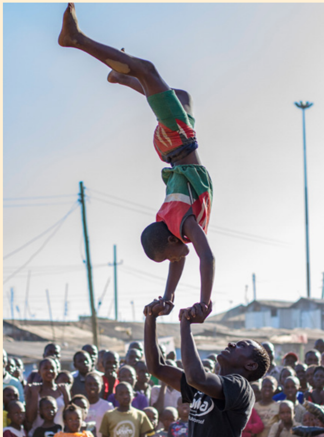
Kibera celebra la vida. Nairobi, Kenia

de 2020: el partenariado UE/ACP, su presente y su futuro , el encuentro de alto nivel que reunió a los embajadores africanos en España y representantes del Ministerio de Asuntos Exteriores y de Cooperación español para comprender mejor las reivindicaciones y expectativas del continente, de cara a la renovación de la asociación entre la Unión Europea y los países ACP.